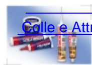
Colle e Attrezzi