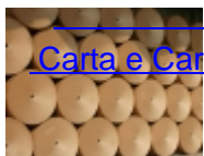
Carta e Cartone